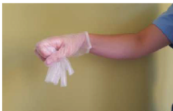
Recoger el primer guante con la otra mano