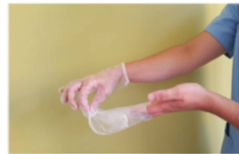
Retirar el guante en su totalidad