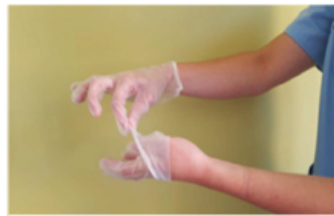
Retirar sin tocar la parte interior del guante