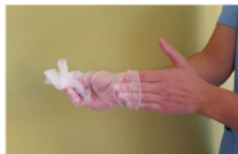
Retirar el segundo guante introduciendo los dedos por el interior