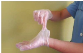
Pellizcar por el exterior del primer guante