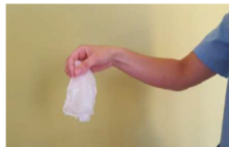
Retirar los dos guantes en el contenedor adecuado